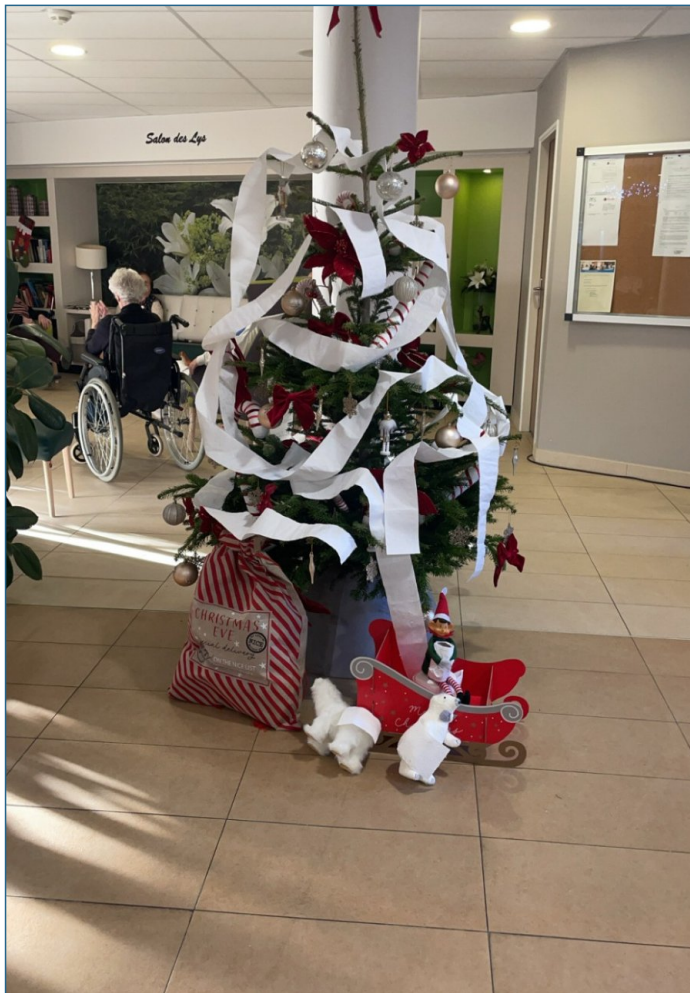
Le lutin continue ses farces