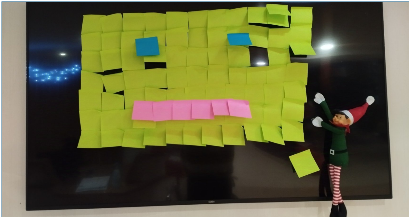
Le lutin continue ses farces