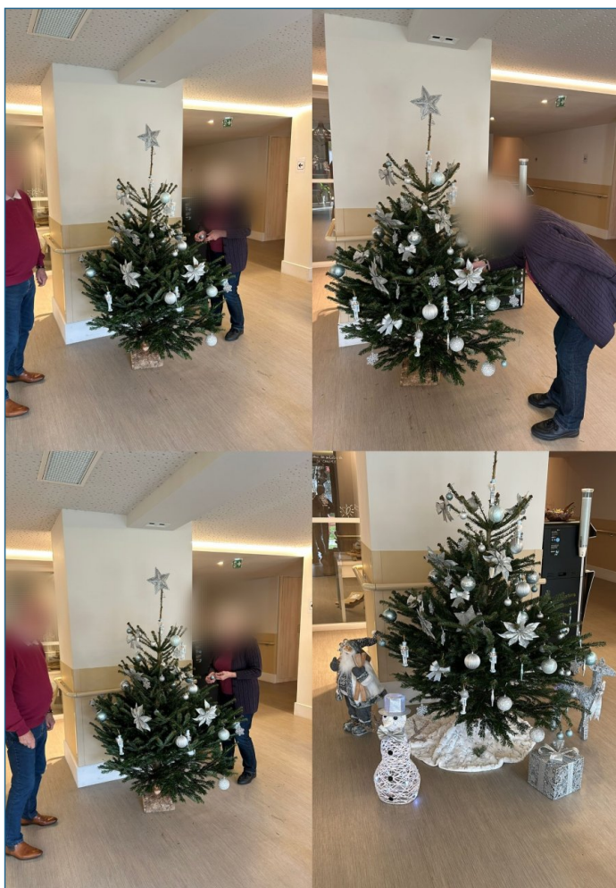
Les résidents de l'accueil de jour ont également préparé leur sapin.