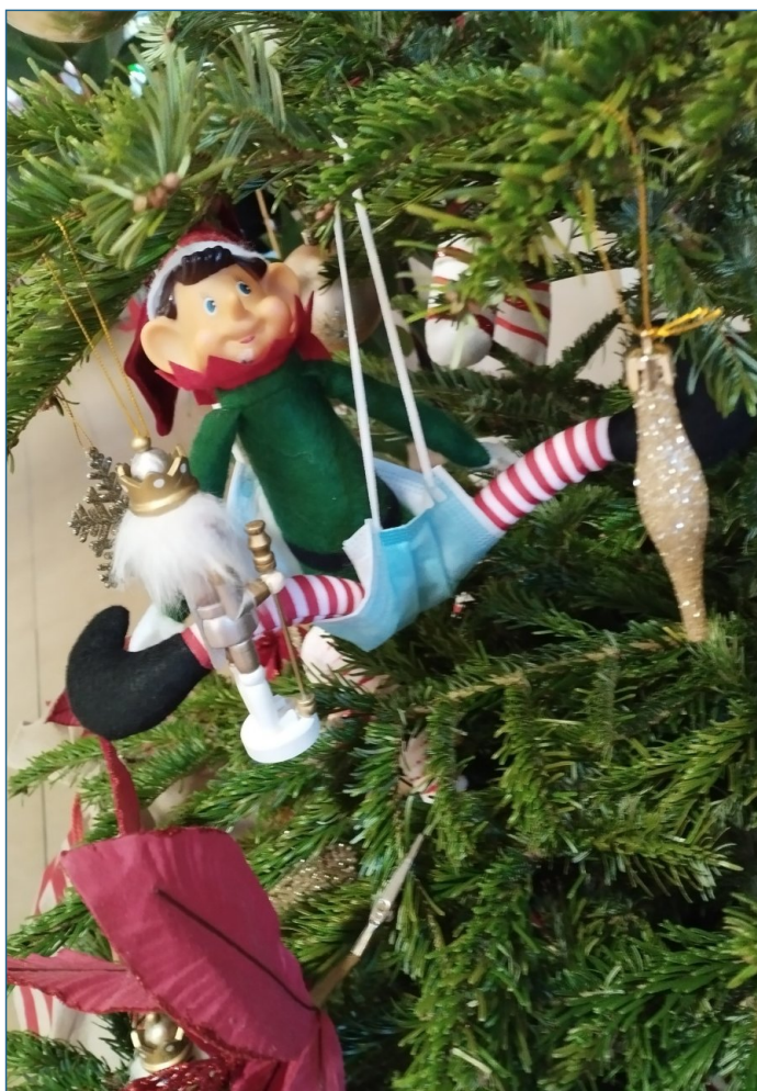
Le lutin farceur

À l'EHPAD, l'atmosphère festive s'installe doucement, et c'est avec enthousiasme que les résidents continuent de préparer les décorations de Noël. Accompagnés de stagiaires et de soignants, chacun met sa touche personnelle pour transformer les espaces en un véritable lieu de magie et de chaleur.