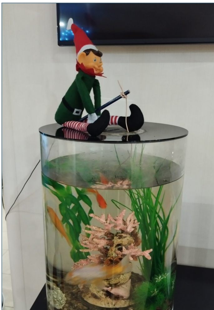
Le lutin a décidé de pêcher