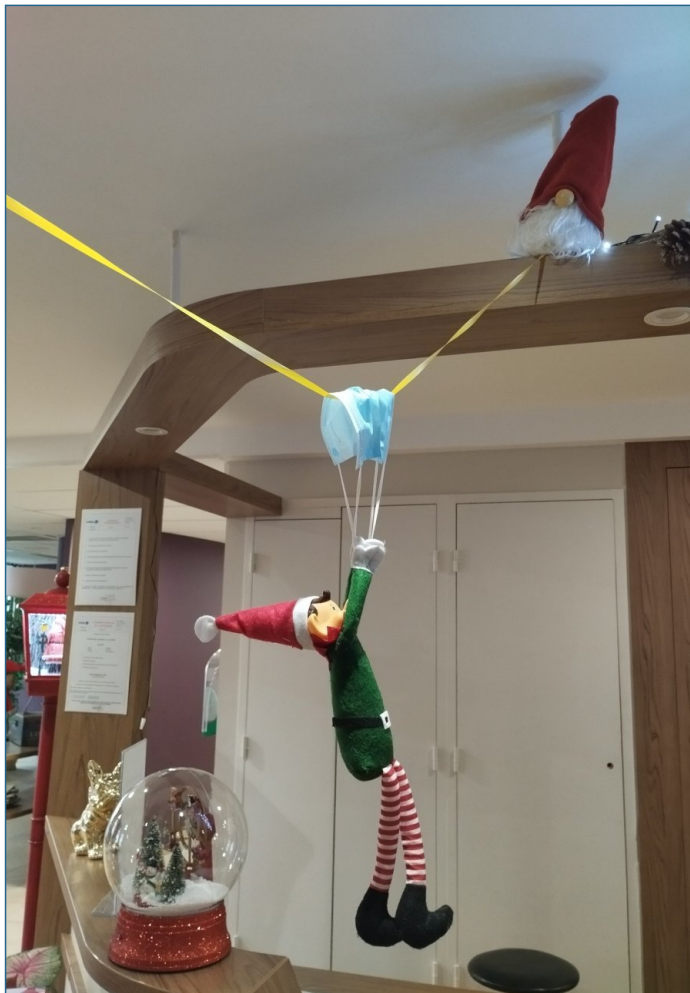
Des nouvelles du lutin